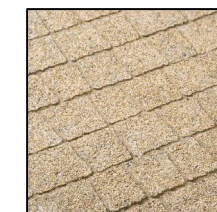
2. CREATIV granit żółty