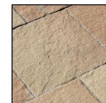
4. FINEZJA pastelowa harmonia