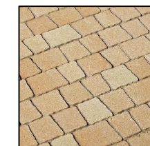
1. CREATIV pastelowa harmonia