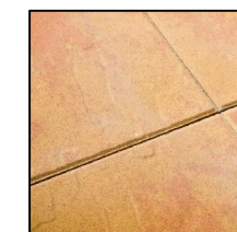
5. PRZEŁOM SKALNY złoty blask

PMB J.SZUMIATA, ul. Antonówka 3, tel. 600 632 093, 607 120 243