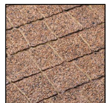
3. CREATIV granit brązowy